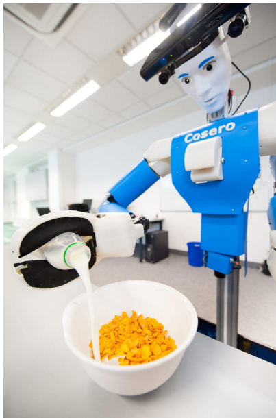
Geschickt: Kein Tropfen geht daneben, als Roboter Cosero die Milch über die Cornflakes gießt.

Bonn. Cosero ist zufrieden. "I've got it", (ich hab's) sagt er, dreht sich um und wirft die leere Milchflasche in den Mülleimer. Geschafft. Die Cornflakes sind fertig. Cosero und seine "Schwester" Dynamaid, die aus dem Kühlschrank noch eine Flasche Orangensaft geholt hat, sind ganz besondere Servierkräfte.